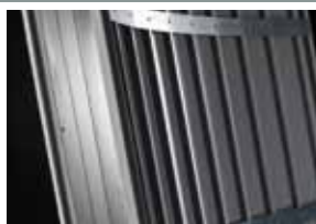
Particolare delle pareti del controtelaio

Appositamente costruiti per scorrere dentro il binario curvo, i carrelli di scorrimento bi-ruota Eclisse si adattano a raggi di curvatura diversi