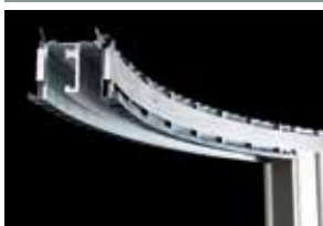
Particolare del binario curvo