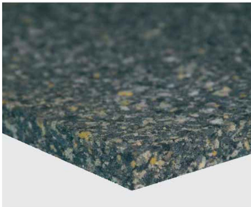
Stopnja absorpcije zvoka ( \alpha_S )

ZVOČNO - ABSORPCIJSKA; ZVOČNO - IZOLACIJSKA PLOŠČA IZ GUME IN POLIURETANA